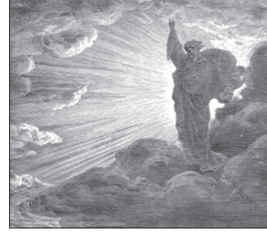
Сотворение мира. Правюра Гюстава Доре.

Еще не так давно каждый школьник, а тем более студент, знал, что учение — свет, а религия — тьма и невежество. Как описывается современному образованному человеку религия и как религиозному человеку описать науку? Наука основана на объективном знании, опирается на конкретные факты. Религия оперирует верой в то, что Нечто и нечто существует вне этого