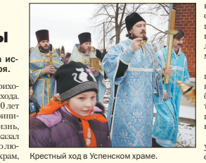
Крестный ход в Успенском храме.

В начале XVIII столетия некий благочестивый живописец привез из Италии список с иконы, изображающей Святое Семейство. На одну женщину обрушилось несчастье: муж отправлен в ссылку, имение отобрано, а сын попал в плен. Женщина обратилась с молитвой к Царице Небесной, Владычи-