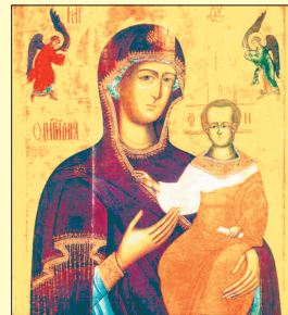
Икона Пресвятой Богородицы Смоленская.

шествия чудотворная Смоленская икона постоянно находилась в рядах наших войск. Накануне Бородинской битвы она была пронесена среди войск, и молитва к Небесной Владычице помогла в сражении нашим доблестным воинам.