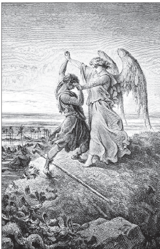
Гравюра Гюстава Доре.

Православная Церковь не запрещает участия в войне, если речь идёт о защите своей Родины. Но без гнева не возьмёшь в руки автомат, а тем более не выступишь в противника.