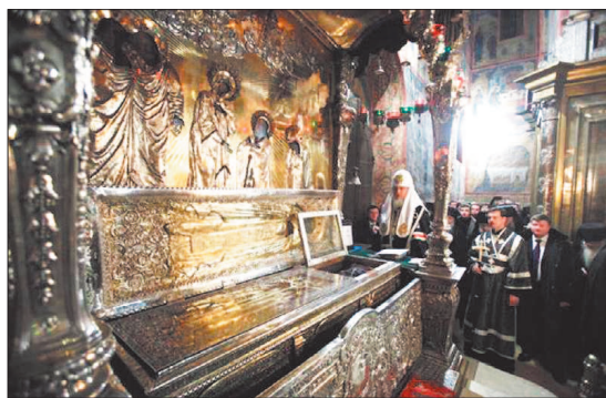
Мощи игумена земли Русской почивают в основанной им Свято-Троицкой Сергиевой Лавре.

что их ожидает чудесное посещение. Через мгновение явилась Божия Матерь в сопровождении святых апостолов Петра и Иоанна Богослова. От необыкновенно яркого света преподобный Сергий пал ниц, но Пресвятая Богородица прикоснулась к нему руками и, благословляя, обещала