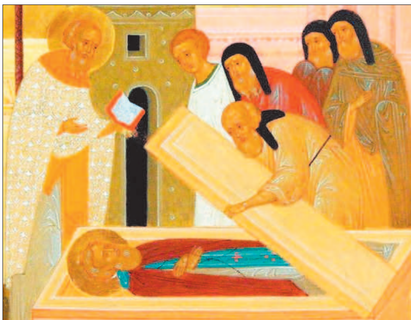
Преставление преподобного Сергия, игумена Радонежского.

За ангельскую жизнь преподобный Сергий удостоился от Бога небесного видения. Однажды ночью авва Сергий читал правило перед иконой Пресвятой Богородицы. Окончив чтение канона Божией Матери, он присел отдохнуть, но вдруг сказал своему ученику, преподобному Михею,