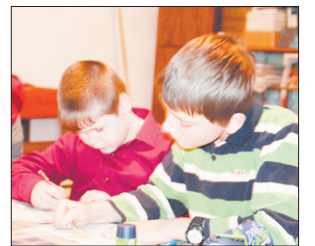
Пусть мальчишки мечтают о подвигах!

Мальчишек особенно поразил тот факт, что Дмитрий Иванович стал правителем в столь же раннем, как у них, возрасте и за свою недолгую жизнь со-